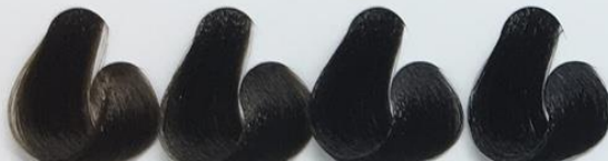
5-0 Castanho Claro 4-0 Castanho 3-0 Castanho Escuro 1-0 Preto