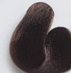
6-41 Louro Escuro Acobreado Cinza