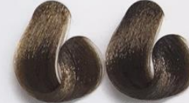
7-71 Louro Marrom Cinza 6-71 Louro Escuro Marrom Cinza