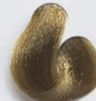
7-3 Louro Dourado