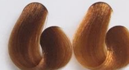
7-40 Louro Médio Acobreado 8-40 Louro Claro Acobreado