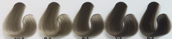
10-1 Louro Extra Claro Cinza 9-1 Louro Claríssimo Cinza 8-1 Louro Claro Cinza 7-1 Louro Cinza 6-1 Louro Escuro Cinza