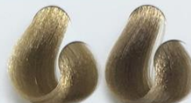
9-31 Louro Claríssimo Bege 8-31 Louro Claro Bege