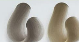
12s-1 Super Clareador Cinza 12s-09 Super Clareador Pérola