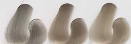
9-01 Gelo 9-02 Pérola 10-12 Gelo Pérola