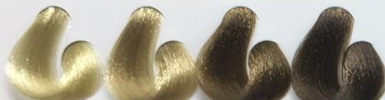
9-0 Louro Claríssimo 8-0 Louro Claro 7-0 Louro 6-0 Louro Escuro