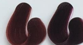
6-66 Louro Escuro Vermelho Profundo 55-62 Red Night