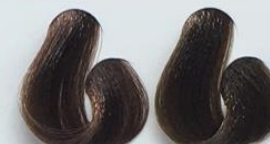
7-7 Louro Chocolate 6-7 Louro Escuro Chocolate