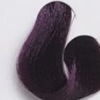
5-20 Castanho Claro Violino Intenso