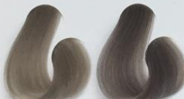
10-89 Louro Extra Claro Pérola 8-89 Louro Claro Pérola