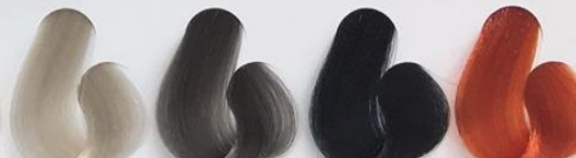
0s-03 Matizador Louro Pérola 0-11 Grafite 0-13 Mate 0-4 Cobre